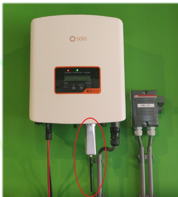
Rood omcirkeld is de wifi dongel

Let op, het is belangrijk dat u niet draait aan de dongel om beschadigingen te voorkomen.